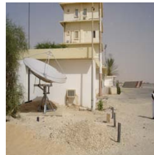
Antenne de la station MSG à l'aéroport de Nouakchott

VGT4 Africa sera disponible au cours du mois de juillet 2007. Il s'agit d'un produit nécessaire pour le suivi des cultures et l'aménagement des territoires.